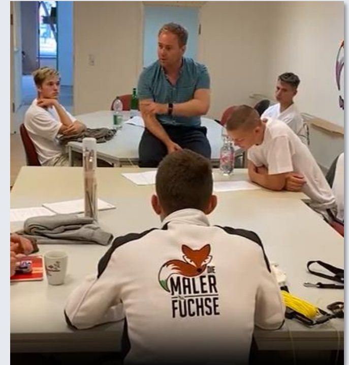
Ein Blick hinter die Kulissen